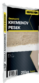
EPOXY SAND ES 30 in ES 80