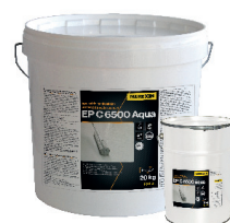
EP C 6500 AQUA