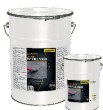
EP FILL 1000