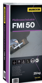
FMI 50 INDUSTRIJSKA IZRAV. MASA